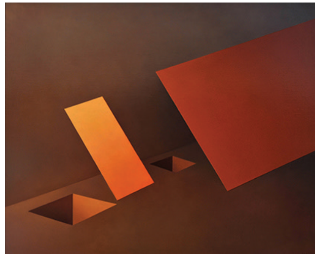
Z cyklu: Przedmioty o specjalnej wartości, 2010, olej, płótno, 81x100 cm BWA nr inw. 1361