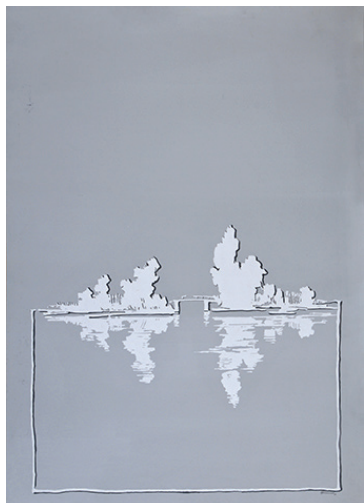
Bez tytułu, 1989 Akryl, papier, 100x70 cm BWA nr inw. BWA 845