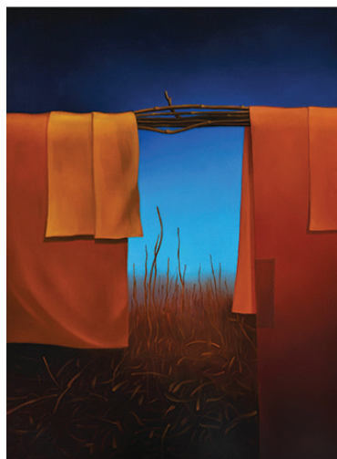
Z cyklu: Teatr po drodze 1989, olej, płótno, 93x74 cm BWA nr inw. 967