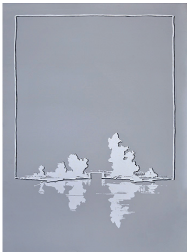
Bez tytułu, 1989 Akryl, papier, 100x70 cm BWA nr inw. BWA 844