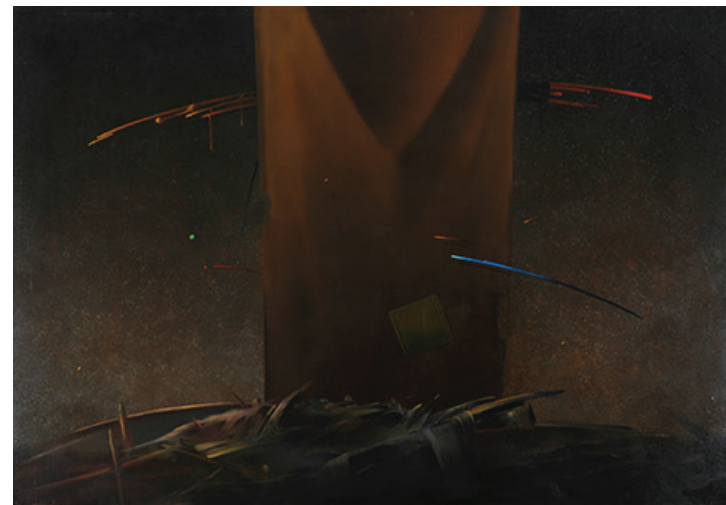
Specjalny prostokąt Olej, płótno, 86 x 121 cm BWA nr inw. 706