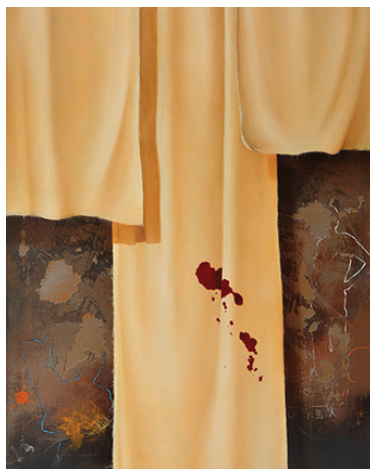
Wołanie do?!, 1988 olej, płótno, 81 x 73 cm BWA nr inw. 748

Ur. w 1956 r. w Kielcach. Zajmuje się rysunkiem i malarstwem sztalugowym. Udział w ważniejszych wystawach ogólnopolskich: Triennale Portretu Współczesnego w BWA w Radomiu, Biennale Małych Form Malarskich BWA w Toruniu (1987), „Arsenał” Warszawa (1988); „Surrealiści Polscy” Częstochowa (1995), XVIII Festiwal Polskiego Malarstwa Współczesnego, Szczecin (2000); IV i V Jesienny Salon Plastyki BWA w Ostrowcu Świętokrzyskim (1999, 2000 – wyróżnienie), Triennale Rysunku Współczesnego (Lubaczów, I nagroda). Wystawy i konkursy regionalne: „Przedwiośnie” BWA w Kielcach (od 1988, Grand Prix w 1996), poplenerowe BWA i doroczne ZPAP.