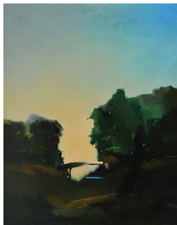
Jakby most, 1989 Olej, płótno, 91 x 73 cm BWA nr inw. 820