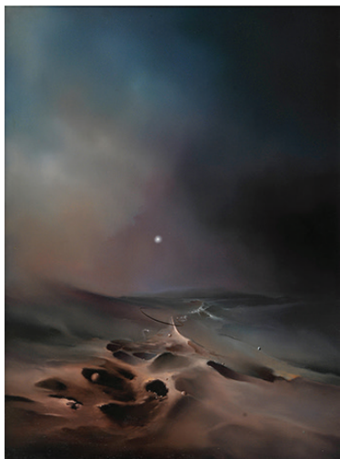
Ostatnia granica, 1986 olej, płótno, 80x60 cm BWA nr inw. 619