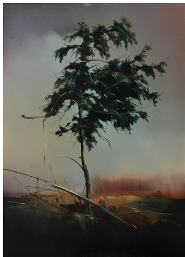
Sosna, 1987 Olej, płótno, 120 x 84 cm BWA nr inw. 660