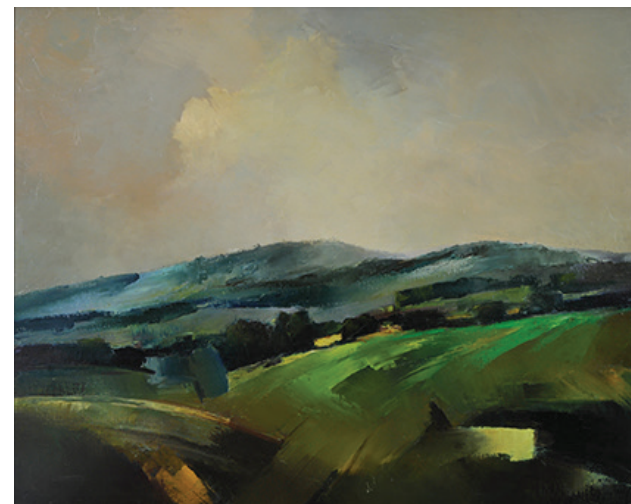
Pola, 1988 olej, płótno, 65 x 81 cm BWA nr inw. 757