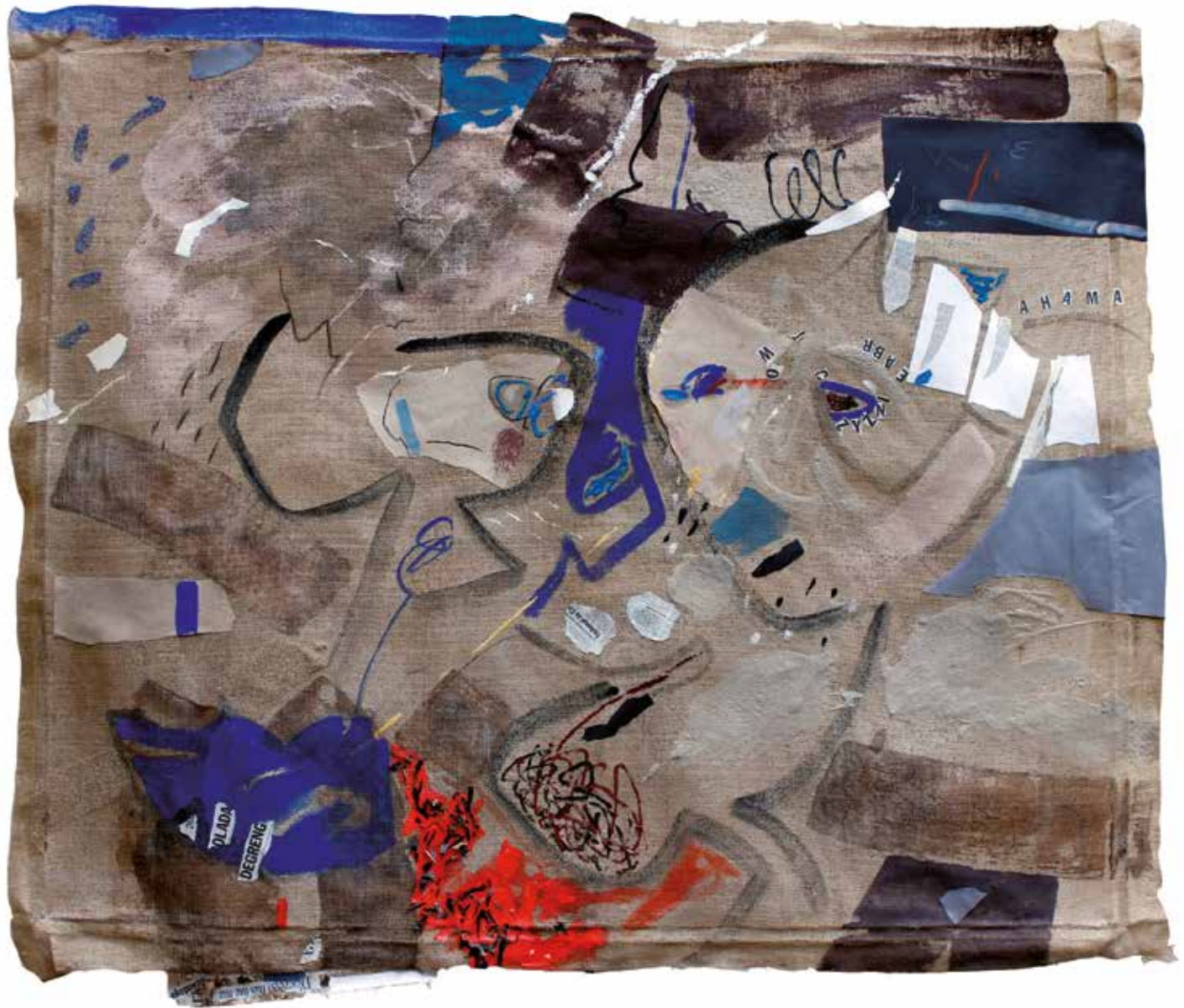
DLACZEGO NAS NIE MA collage, 140 x 170 cm, 2014