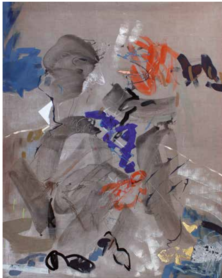
FRIDA technika mieszana, płótno, 160 x 140 cm, 2014