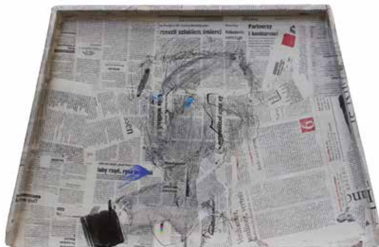
AUTOPORTRET tusz, piórko na desce, 45 x 70 cm, 2015