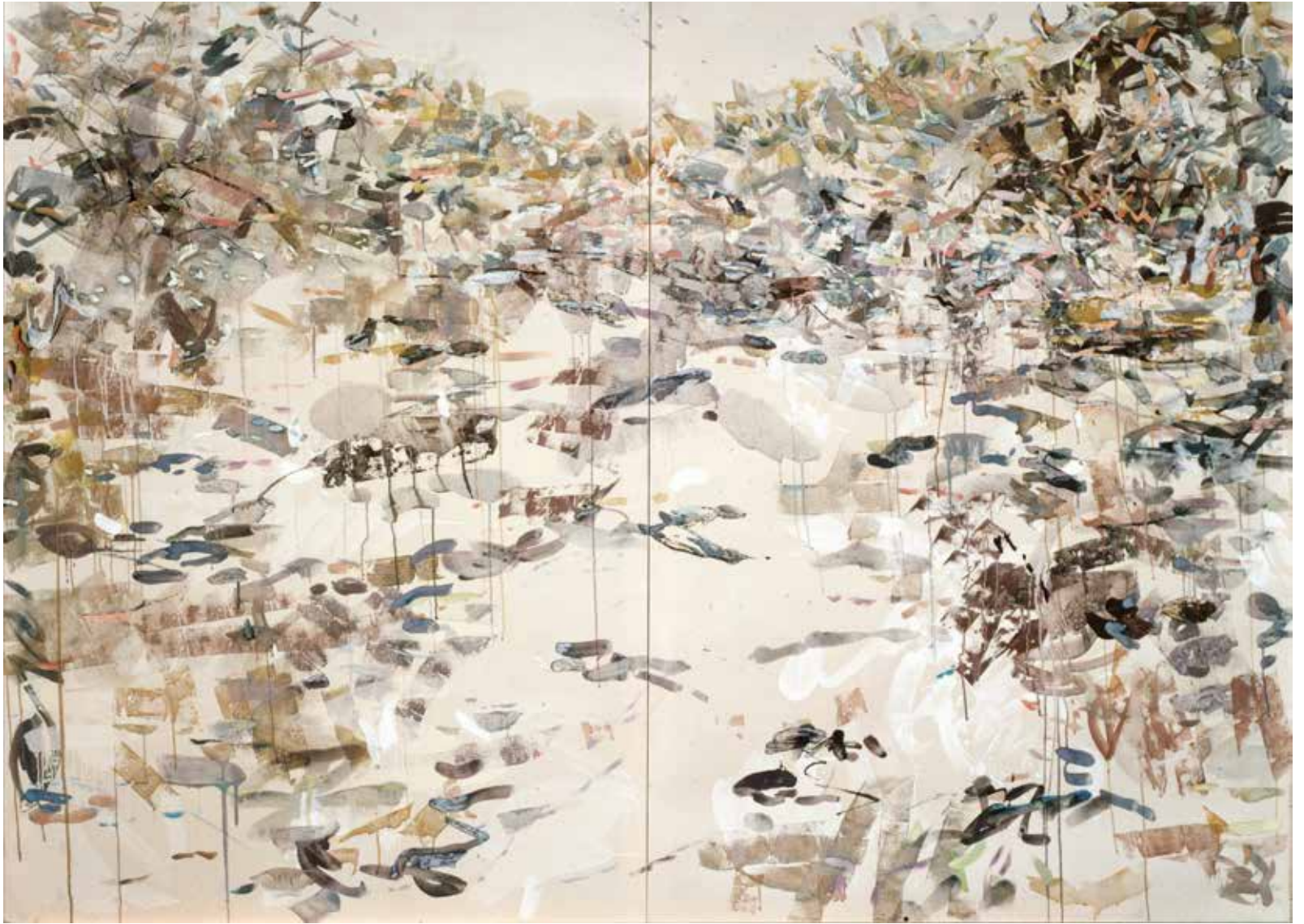
WODNY OGRÓD technika mieszana, płótno, 200 x 280 cm, 1999