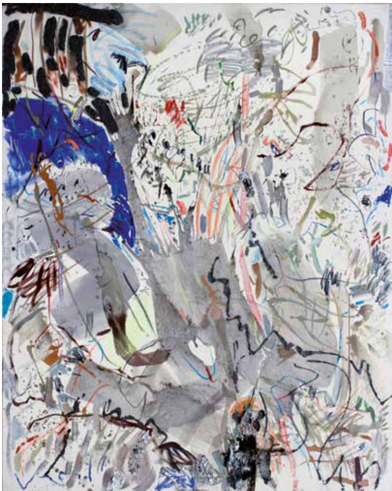
DRZEWO OLIWNE technika mieszana, płótno, 175 x 140 cm, 2014