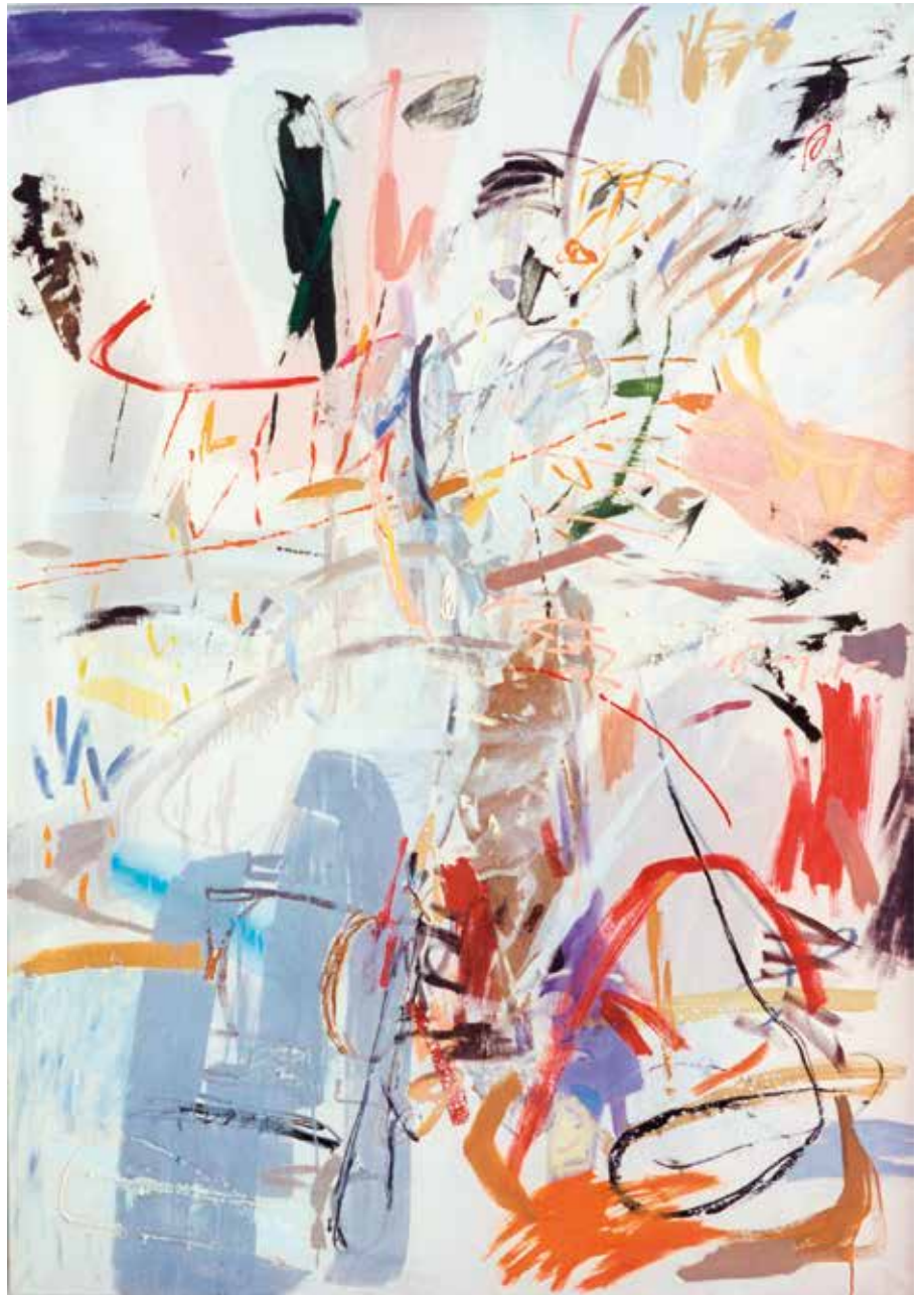
CZŁOWIEK Z MASZYNĄ technika mieszana, płótno, 200 x 140 cm, 1992