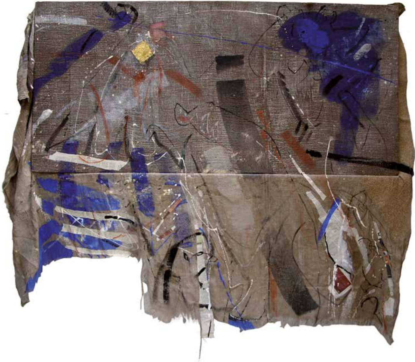
HERMENEUTYKA CHLEBA POWSZEDNIEGO technika własna, 150 x 200 cm, 2011