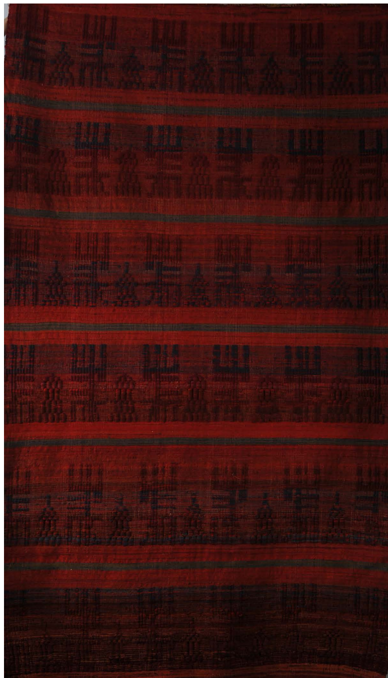
Łysica b.r. tkanina 250x150 cm BWA nr inw. 416