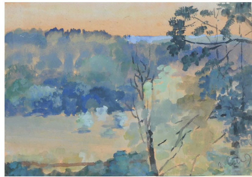
Pejzaż Bałtowa 1985 akwarela, papier 21x29 cm BWA nr inw. 616