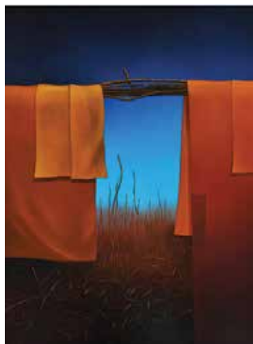
Z cyklu: Teatr po drodze 1989, olej, płótno, 93x74 cm BWA nr inw. 967