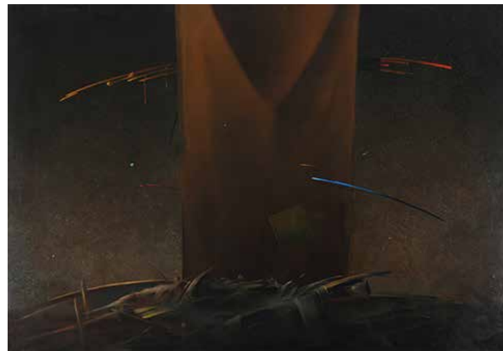
Specjalny prostokąt Olej, płótno, 86 x 121 cm BWA nr inw. 706