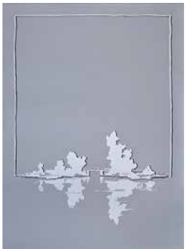
Bez tytułu, 1989 Akryl, papier, 100x70 cm BWA nr inw. BWA 844