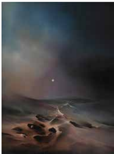
Ostatnia granica, 1986 olej, płótno, 80x60 cm BWA nr inw. 619