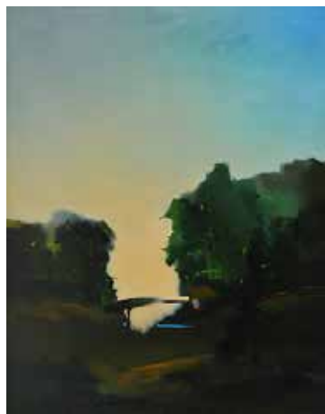
Jakby most, 1989 Olej, płótno, 91 x 73 cm BWA nr inw. 820