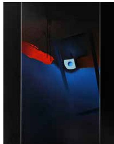
Z cyklu Teledysk, 1989 Olej, płótno, 90 x 71 cm BWA nr inw. 796