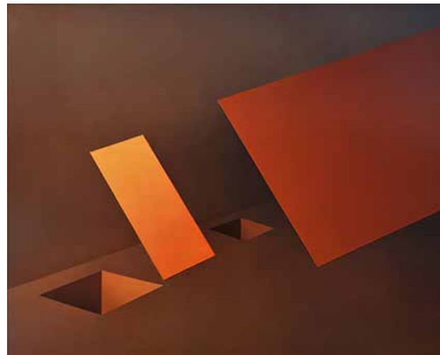
Z cyklu: Przedmioty o specjalnej wartości, 2010, olej, płótno, 81x100 cm BWA nr inw. 1361