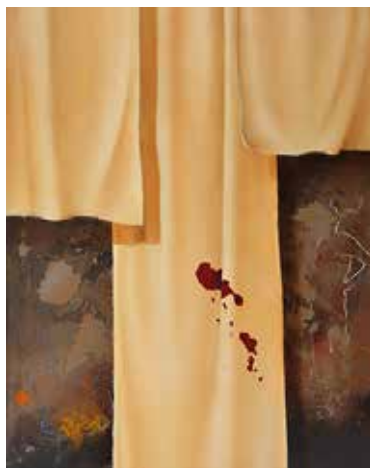
Wołanie do?!, 1988 olej, płótno, 81 x 73 cm BWA nr inw. 748

Ur. w 1956 r. w Kielcach. Zajmuje się rysunkiem i malarstwem sztalugowym. Udział w ważniejszych wystawach ogólnopolskich: Triennale Portretu Współczesnego w BWA w Radomiu, Biennale Małych Form Malarskich BWA w Toruniu (1987), „Arsenał” Warszawa (1988); „Surrealiści Polscy” Częstochowa (1995), XVIII Festiwal Polskiego Malarstwa Współczesnego, Szczecin (2000); IV i V Jesienny Salon Plastyki BWA w Ostrowcu Świętokrzyskim (1999, 2000 – wyróżnienie), Triennale Rysunku Współczesnego (Lubaczów, I nagroda). Wystawy i konkursy regionalne: „Przedwiośnie” BWA w Kielcach (od 1988, Grand Prix w 1996), poplenerowe BWA i doroczne ZPAP.