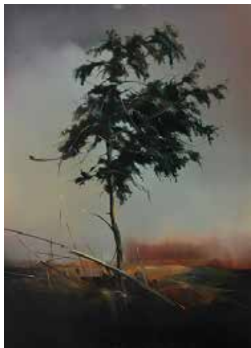
Sosna, 1987 Olej, płótno, 120 x 84 cm BWA nr inw. 660