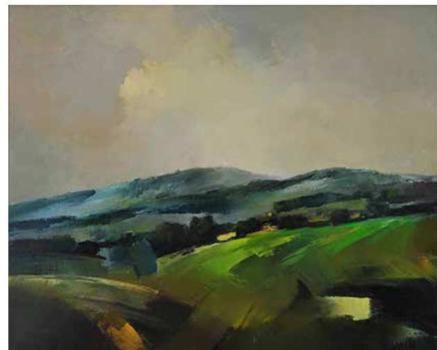
Pola, 1988 olej, płótno, 65 x 81 cm BWA nr inw. 757