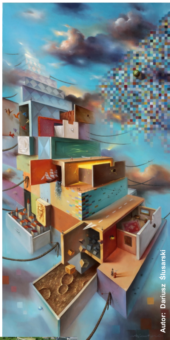
Autor: Dariusz Ślusarski

Dokładne informacje o zasadach zgłoszenia do Programu "Derby Artystyczne' 2015", oraz druki niezbędne do dokonania zgłoszenia, dostępne są na oficjalnej stronie informacyjnej pod adresem: www.art-plus.info/derby