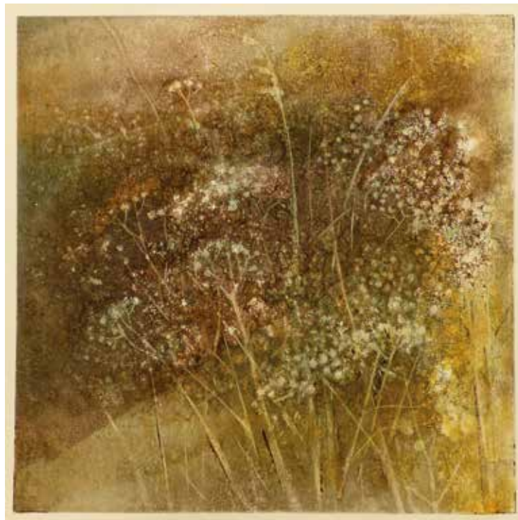
PEJZAŻ SYNTETYCZNY – TRAWY 1-4 monotypia, papier, farby offsetowe, 4 x 48 x 48 cm