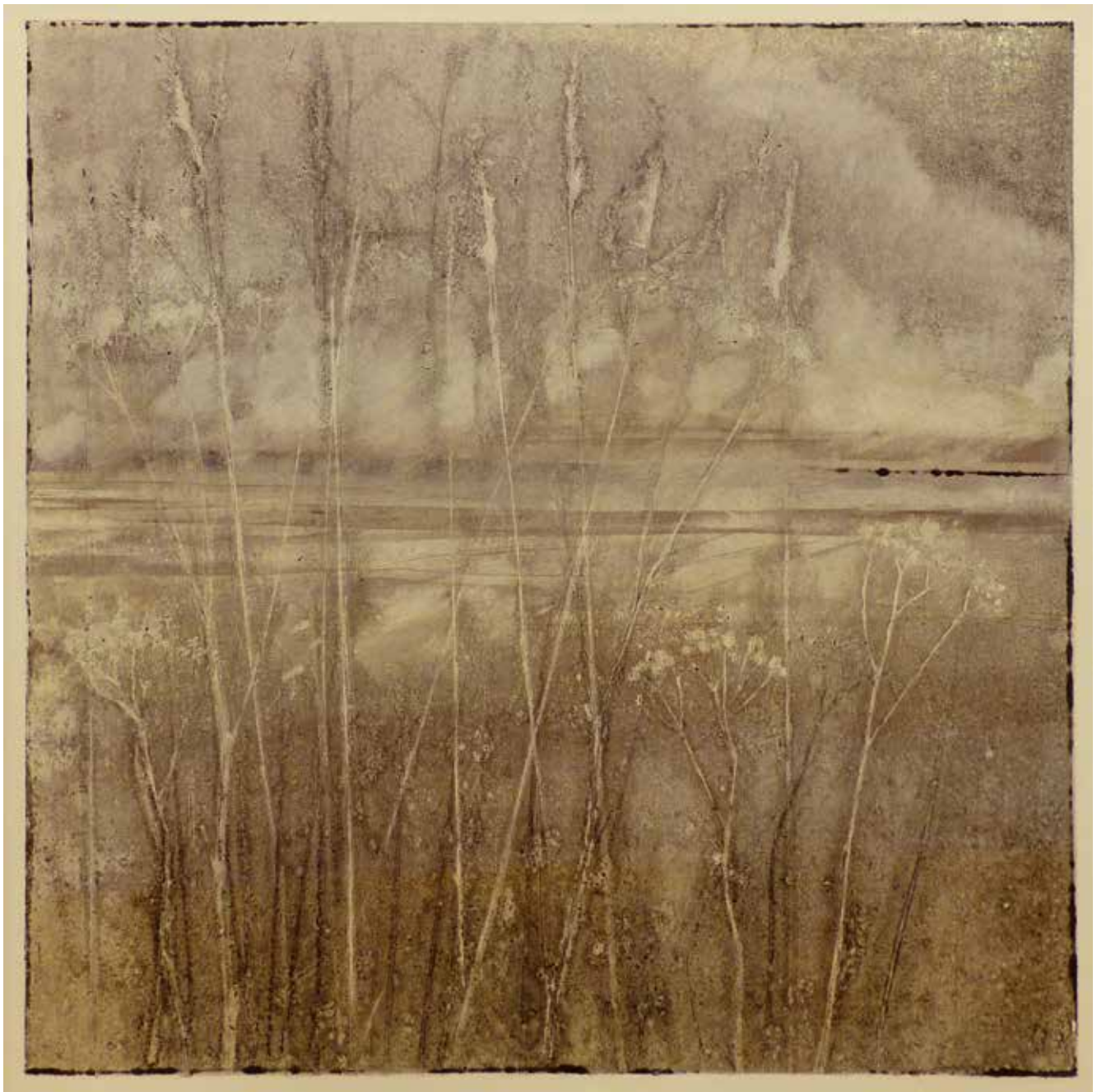
PEJZAŽ TRAWY 8 monotypia, papier, farby offsetowe, 48 x 48 cm