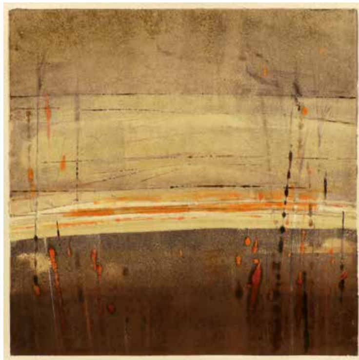
PEJZAŻ ŚWIĘTOKRZYSKI 1-2 monotypia, papier, farby offsetowe, 2 x 48 x 48 cm