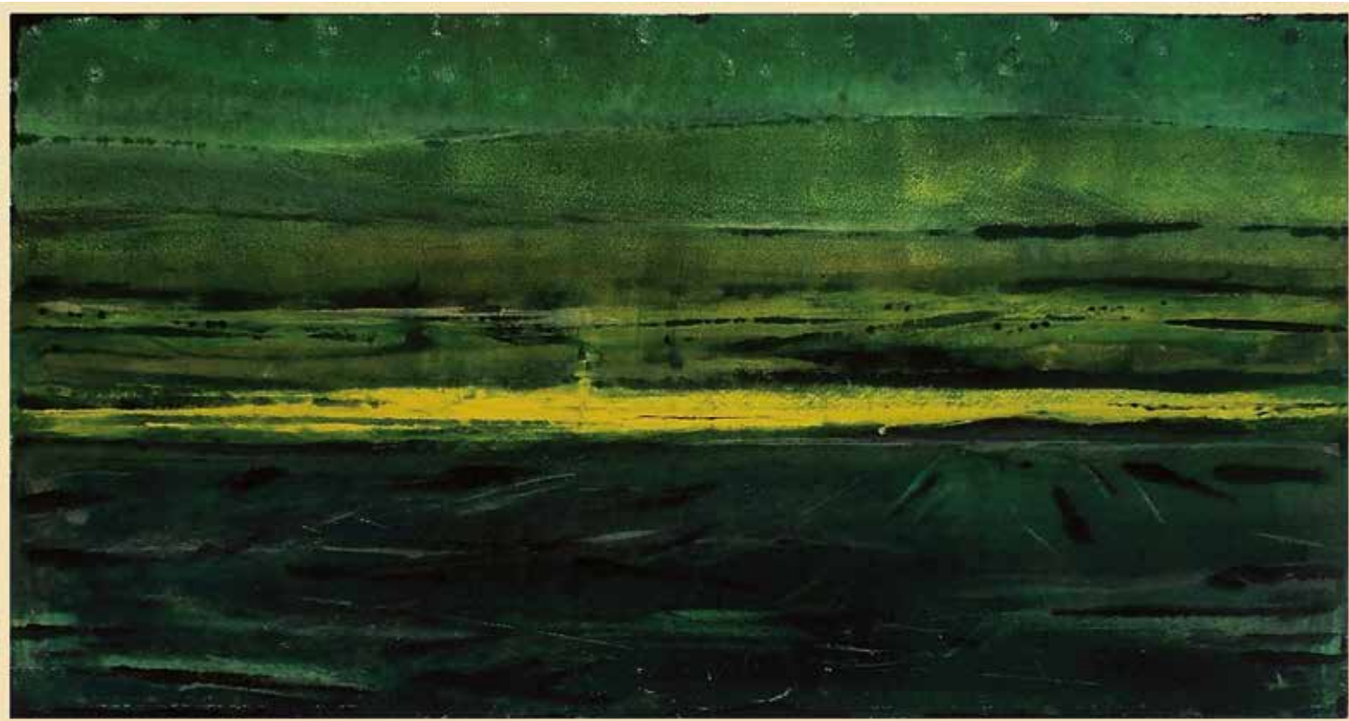
PEJZAŻ SYNTETYCZNY. POLA – WIOSNA monotypia, papier, farby offsetowe, 48 x 90 cm