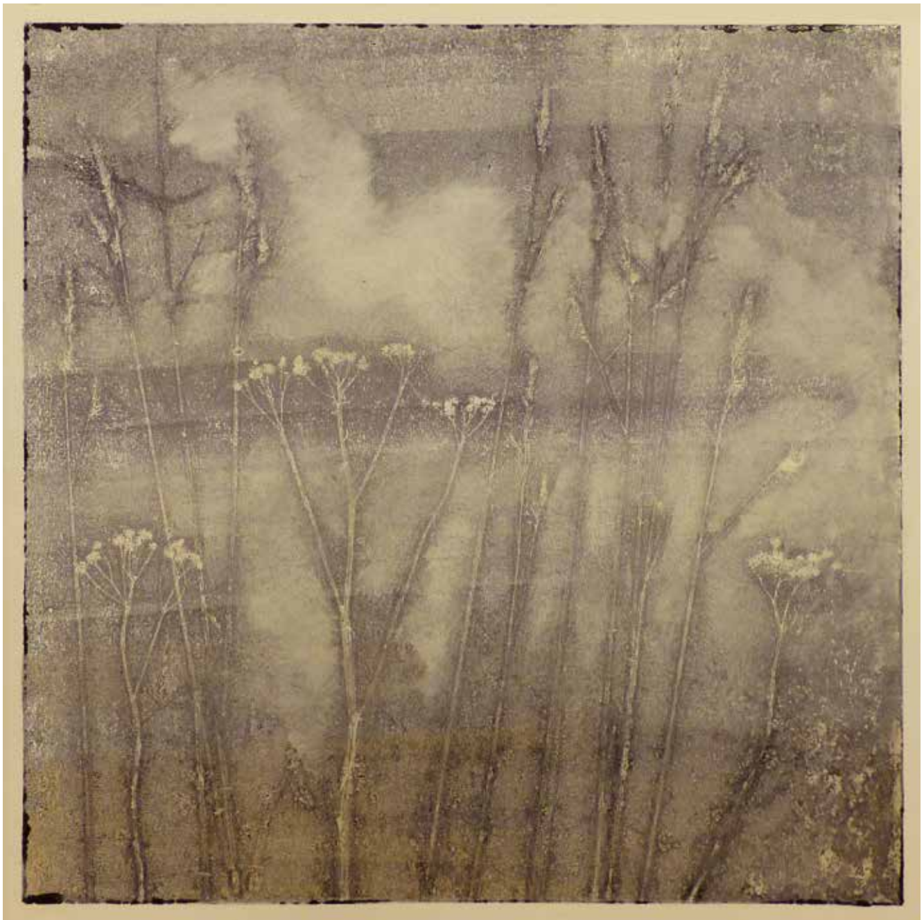
PEJZAŻ TRAWY 2 monotypia, papier, farby offsetowe, 48 x 48 cm