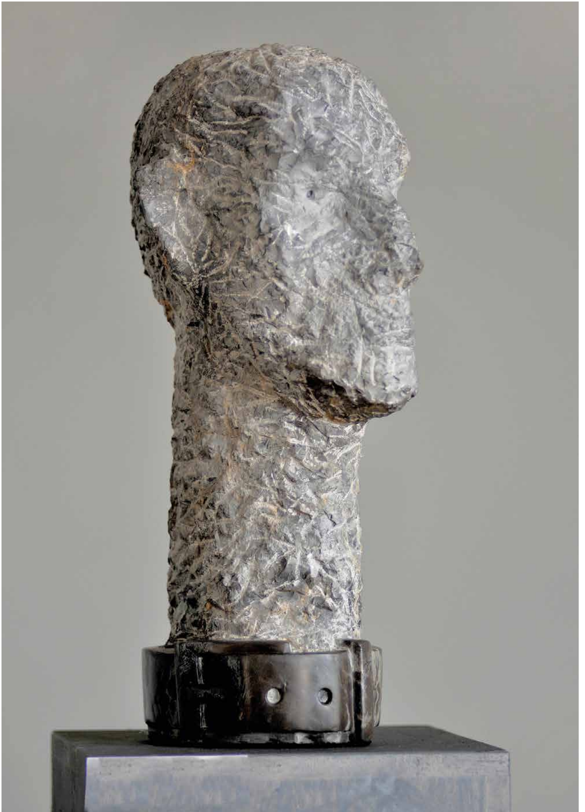
PROCES , marmur, 92 cm