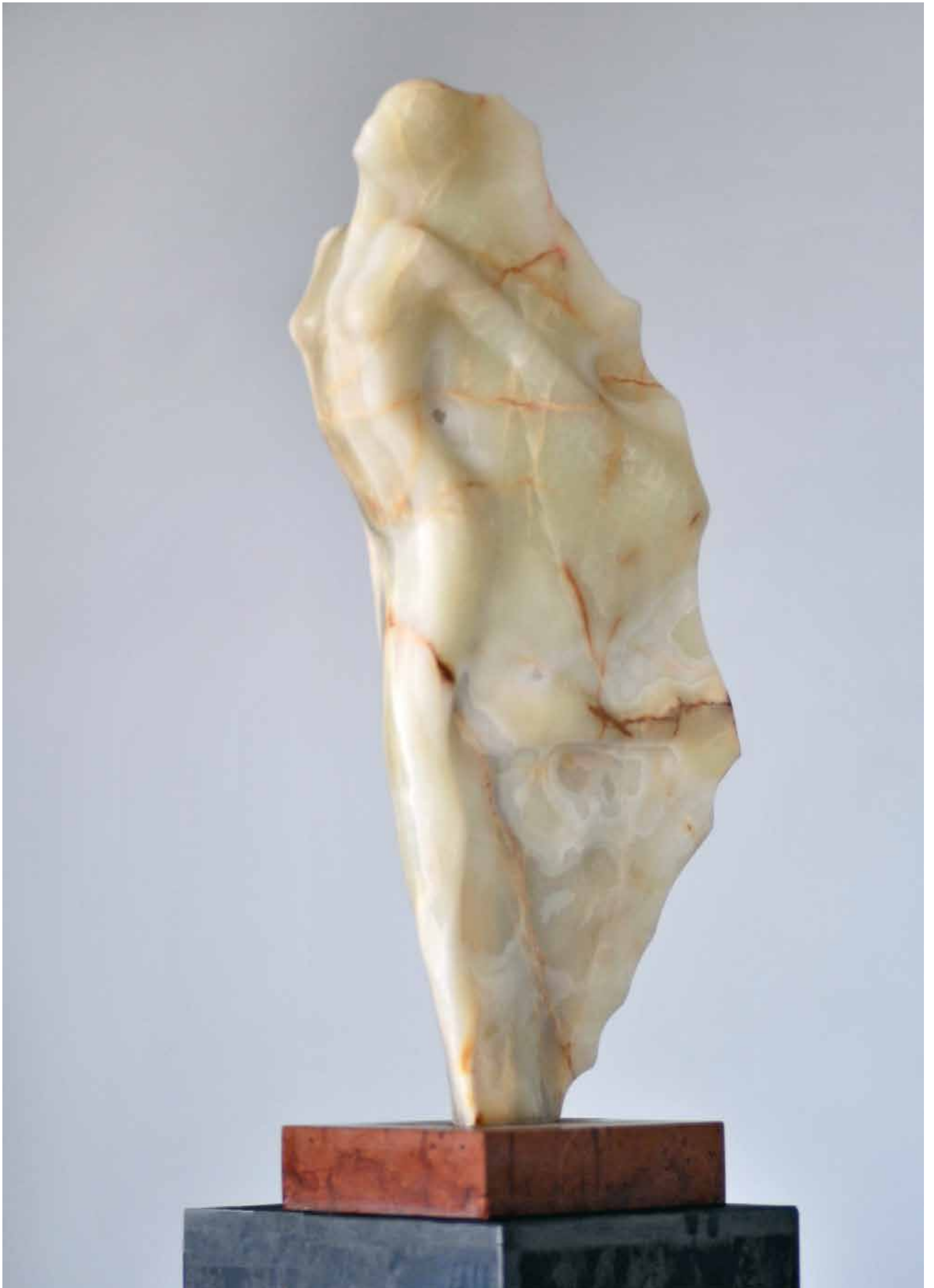
WIOSNA, marmur, 78 cm