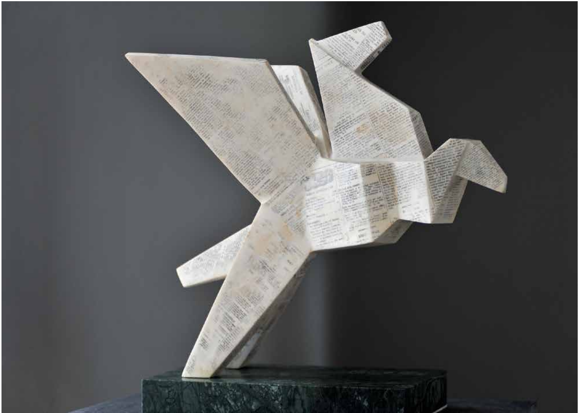
MIT , marmur Carrara, 54 cm