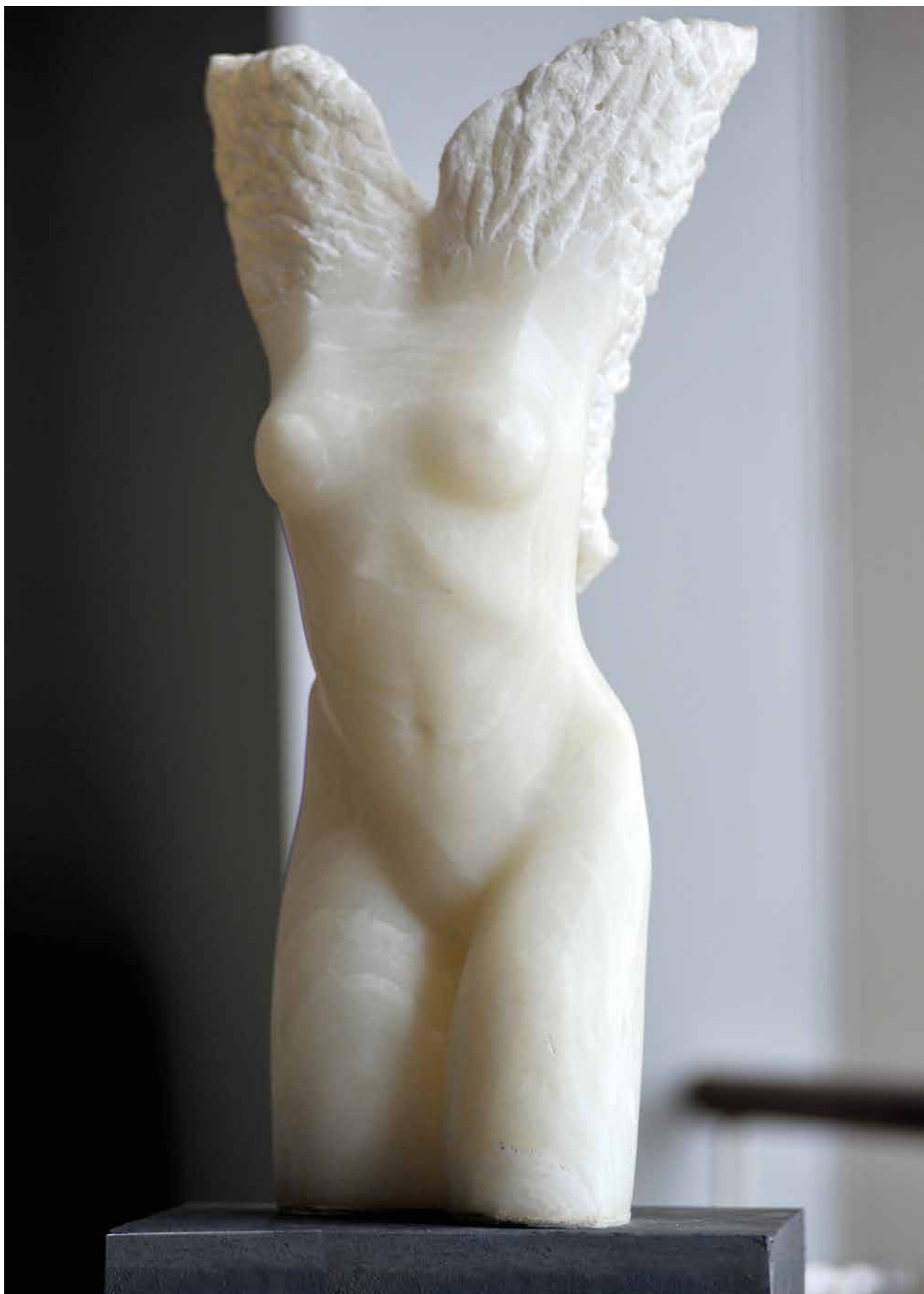
TWORZYWO , marmur, 60 cm