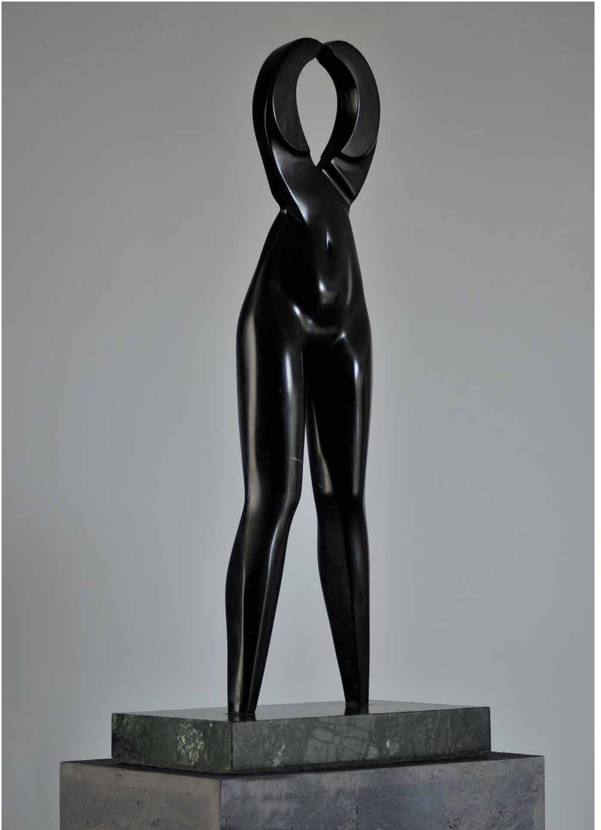
SCARLETT , marmur, 81 cm