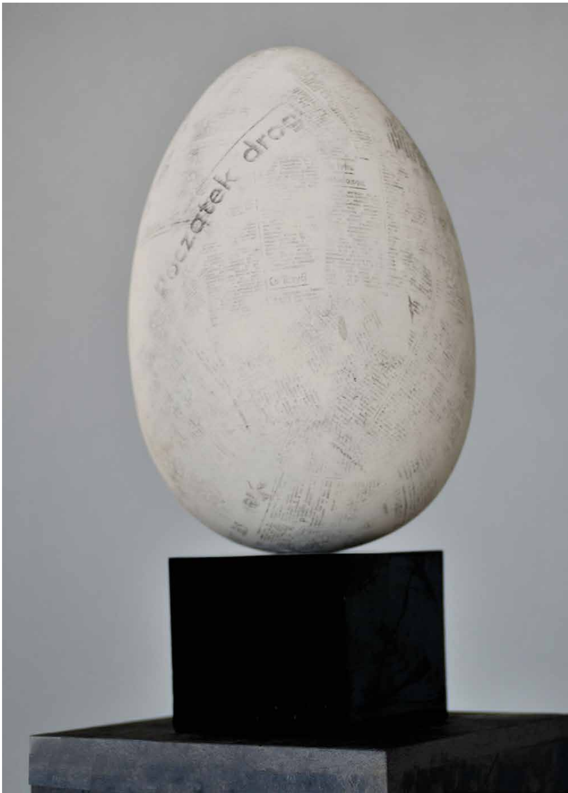
POCZĄTEK DROGI , marmur, 51 cm