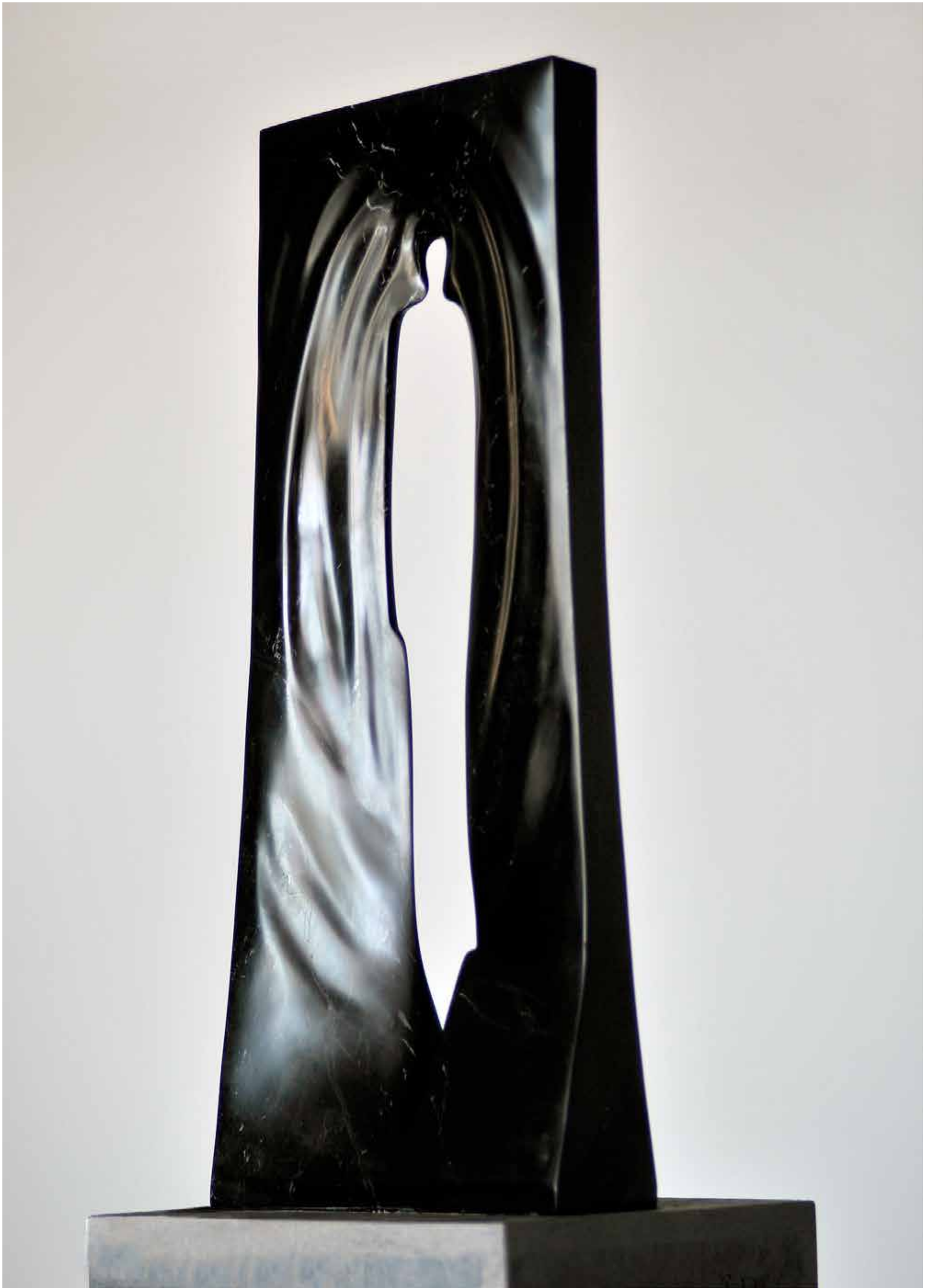
WCZORAJ , marmur, 64 cm