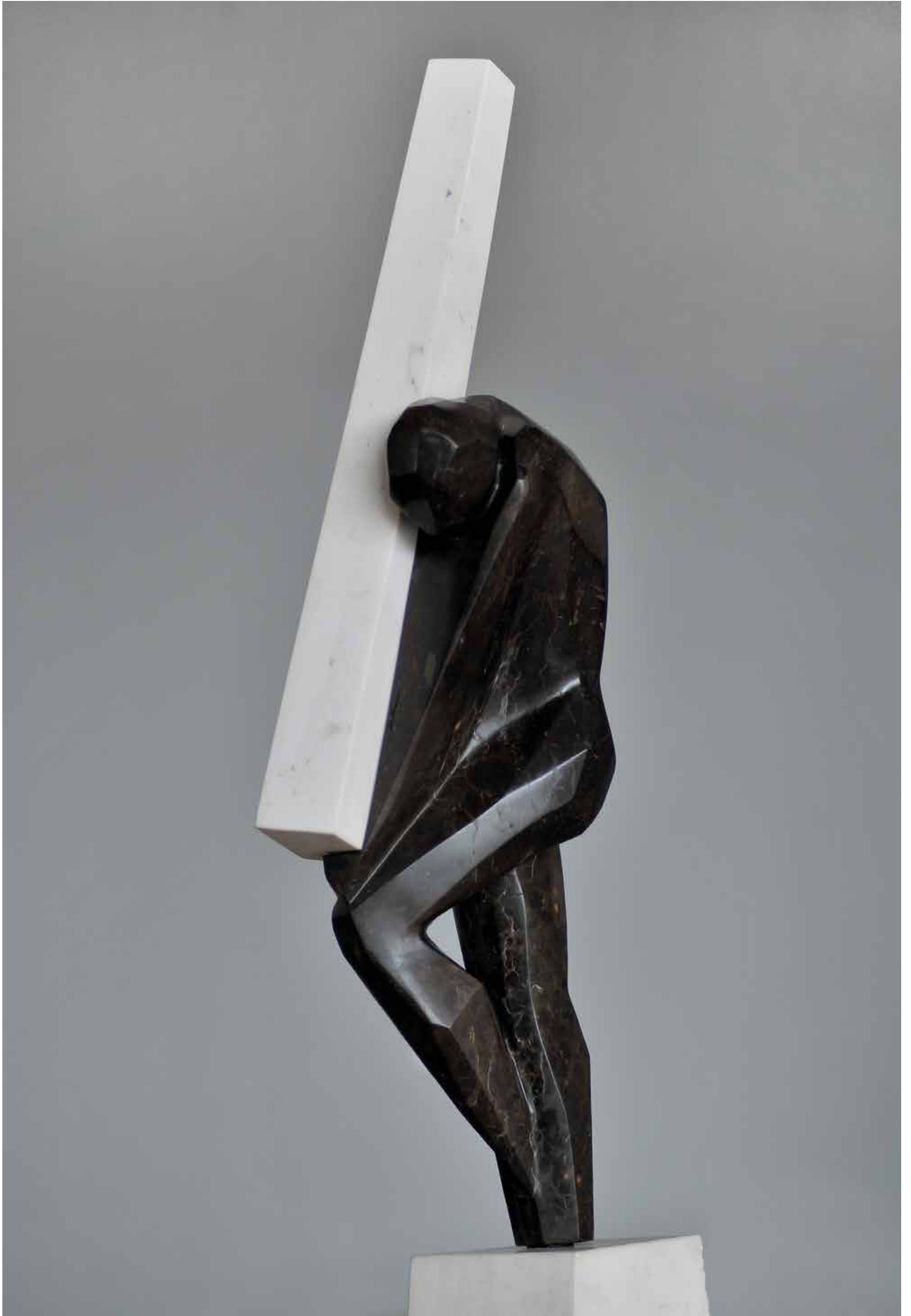
ECCE HOMO , marmur, 180 cm