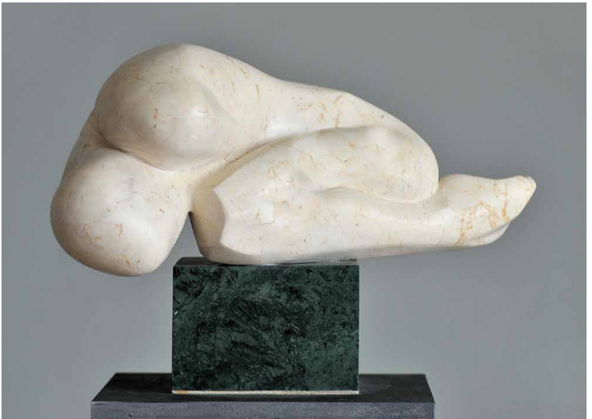
SEN , marmur, 39x58 cm

GRZEGORZ SZMELTER wstęp do folderu „Wystawa rzeźb Waldemara Musika”, Filharmonia Kaszubska w Wejherowie