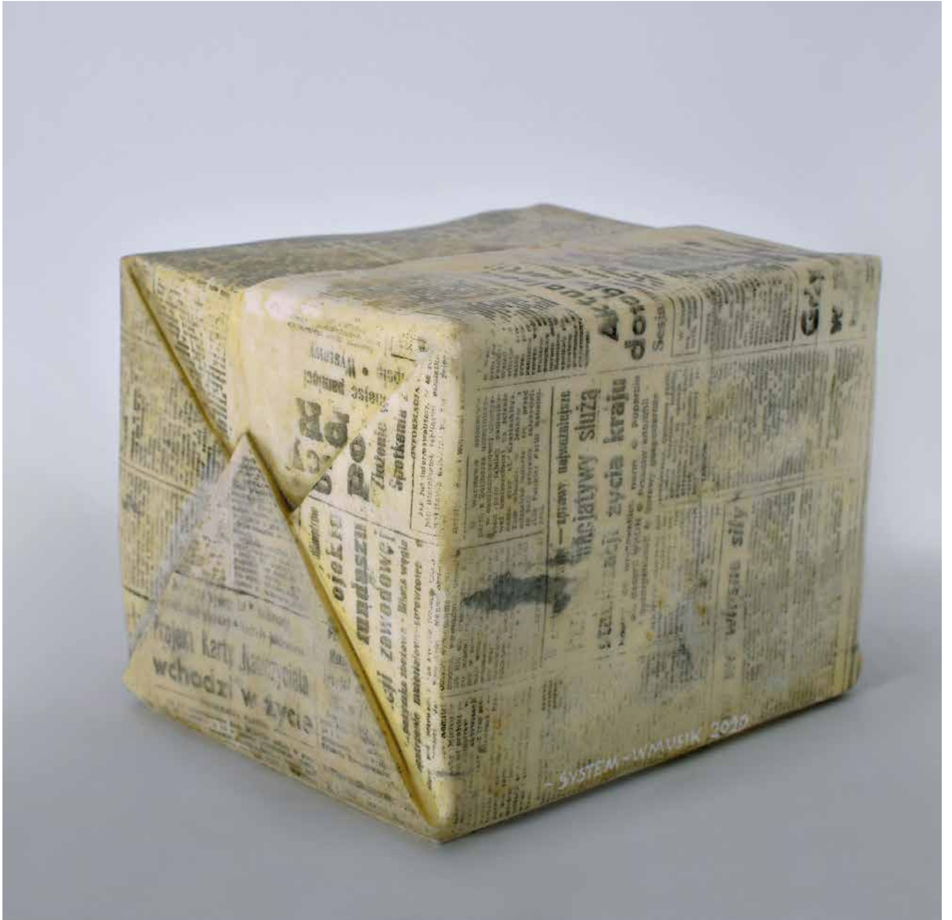
SYSTEM, marmur Carrara, 23x28x17 cm