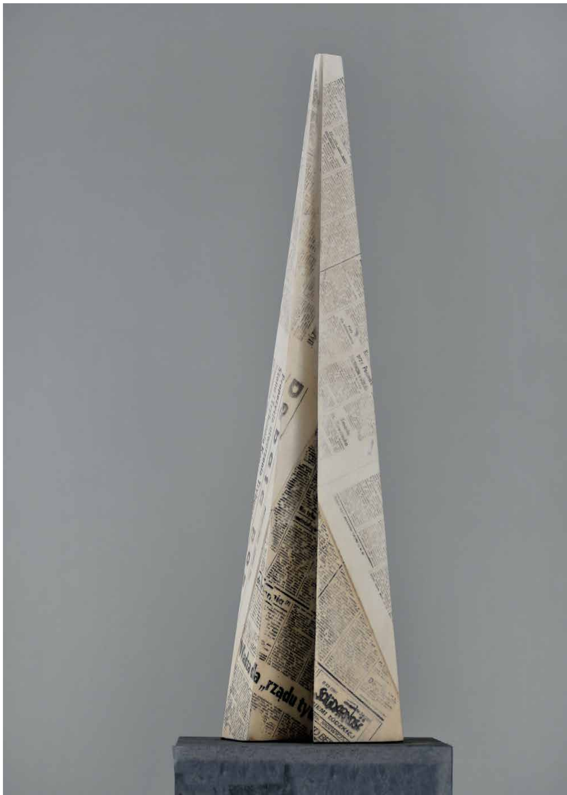
MISJA , marmur, 78 cm