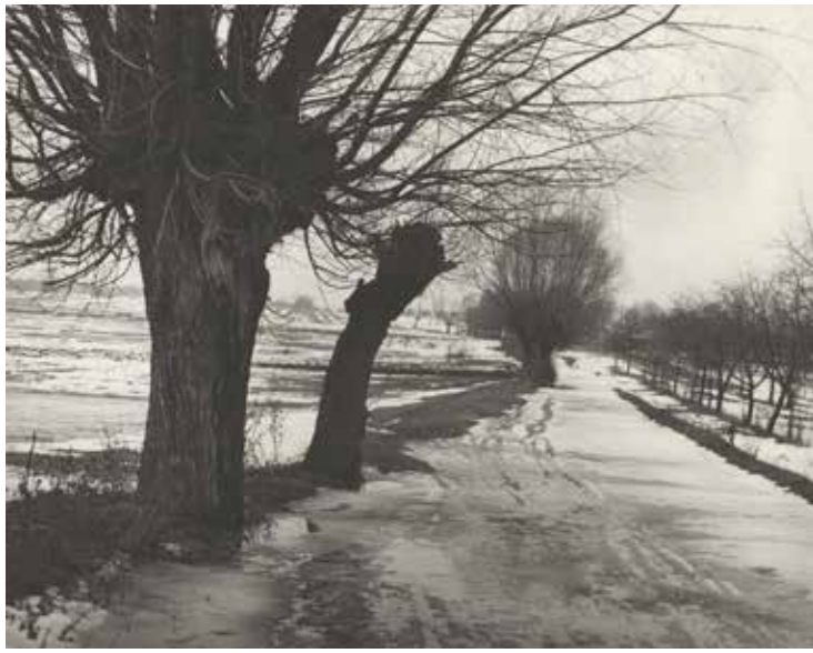
Jan Siudowski | Pejzaż zimowy