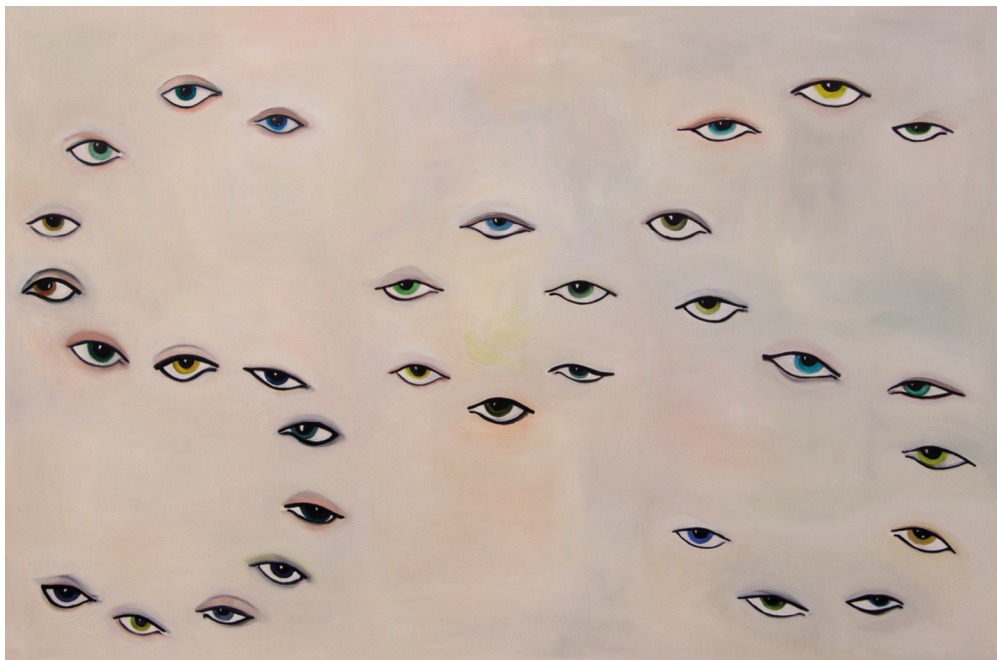
> OCZY OPATRZNOŚCI