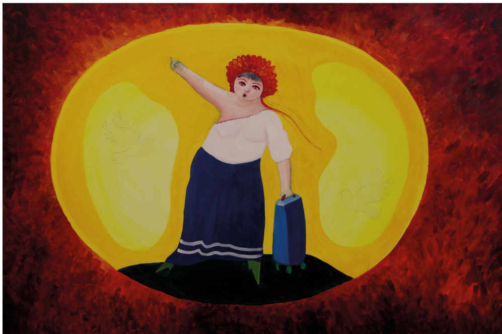
> F_CK OFF