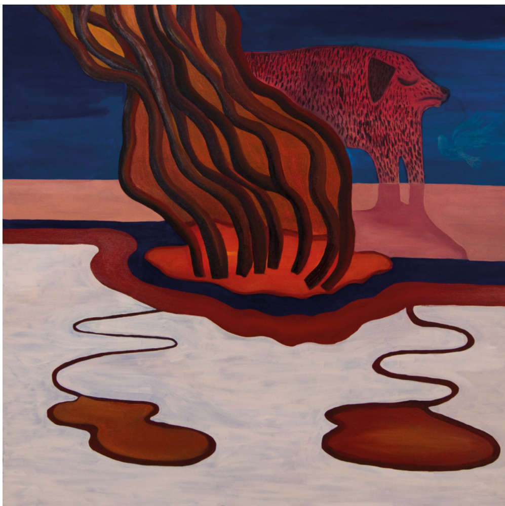
> WROTA PIEKIEŁ