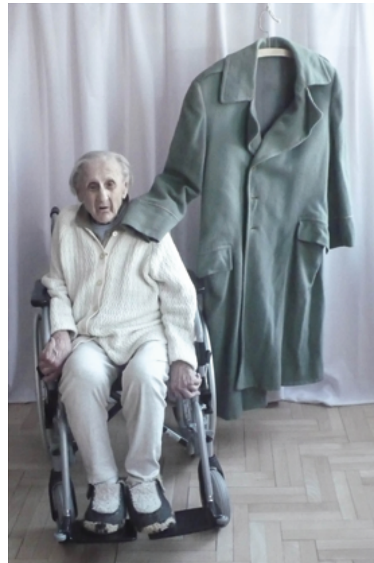
ON 3 2013