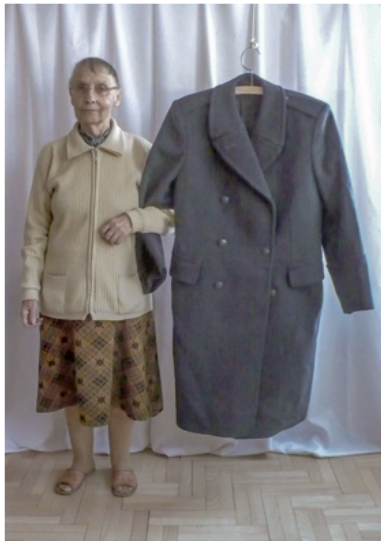
ON 5 2013