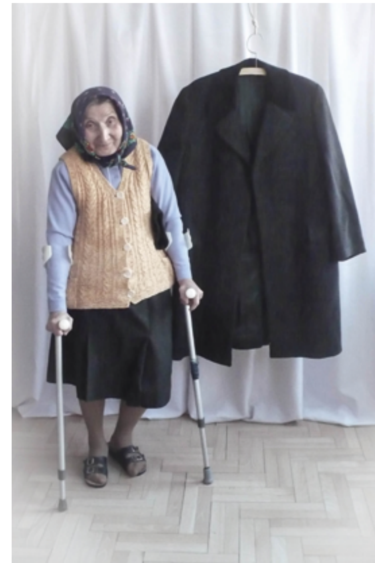
ON 4 2013