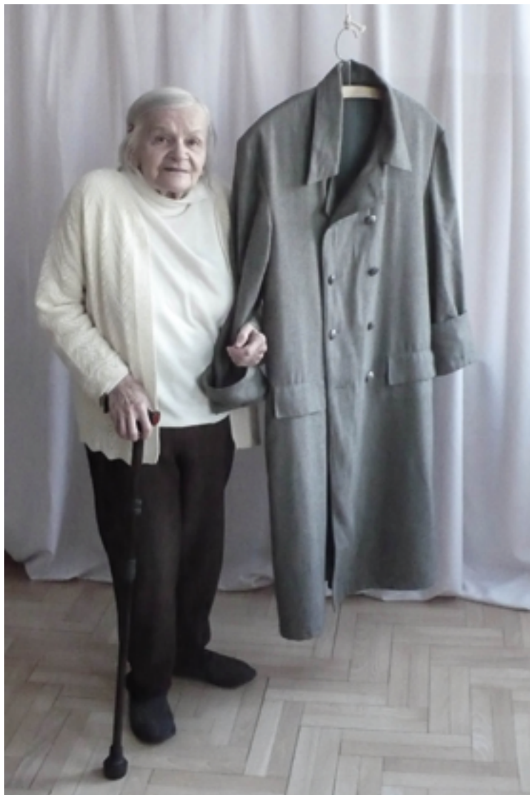
ON 1 2013