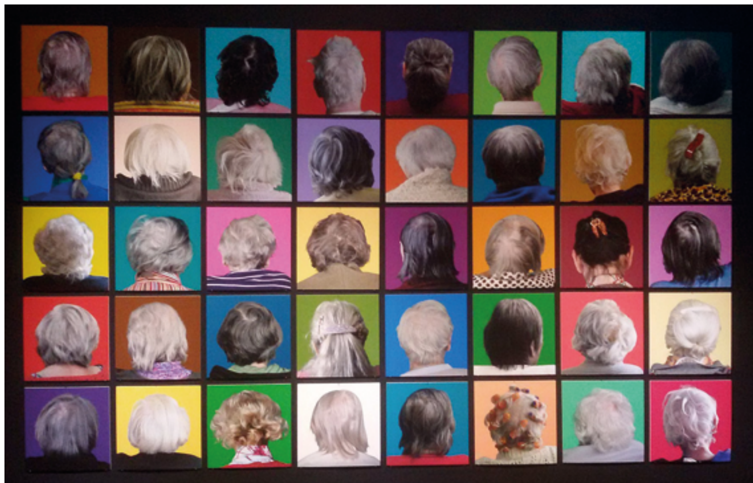
MARILYN BYŁABY JEDNĄ Z NAS 2016