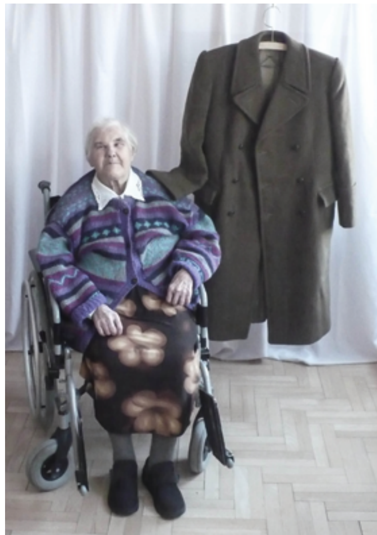
ON 6 2013