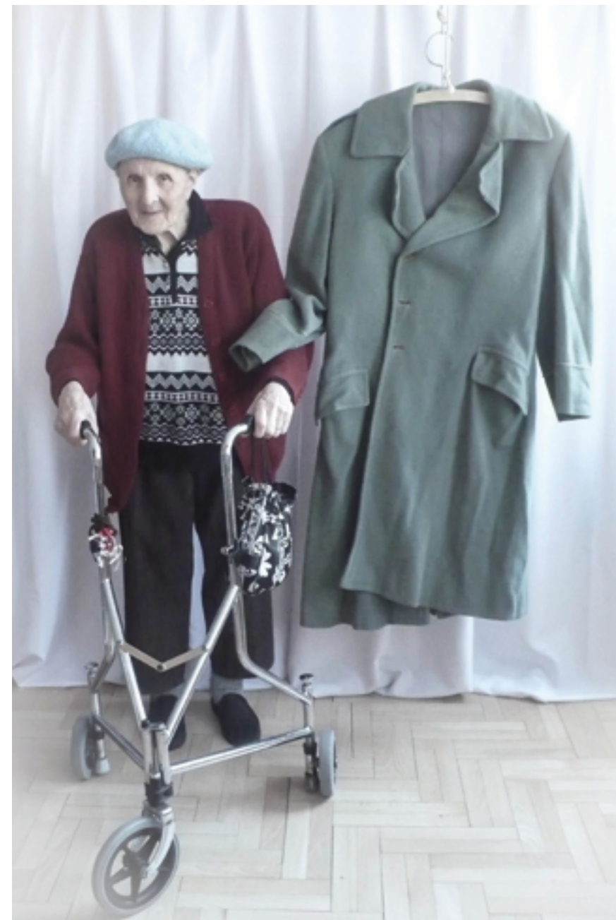
ON 7 2013