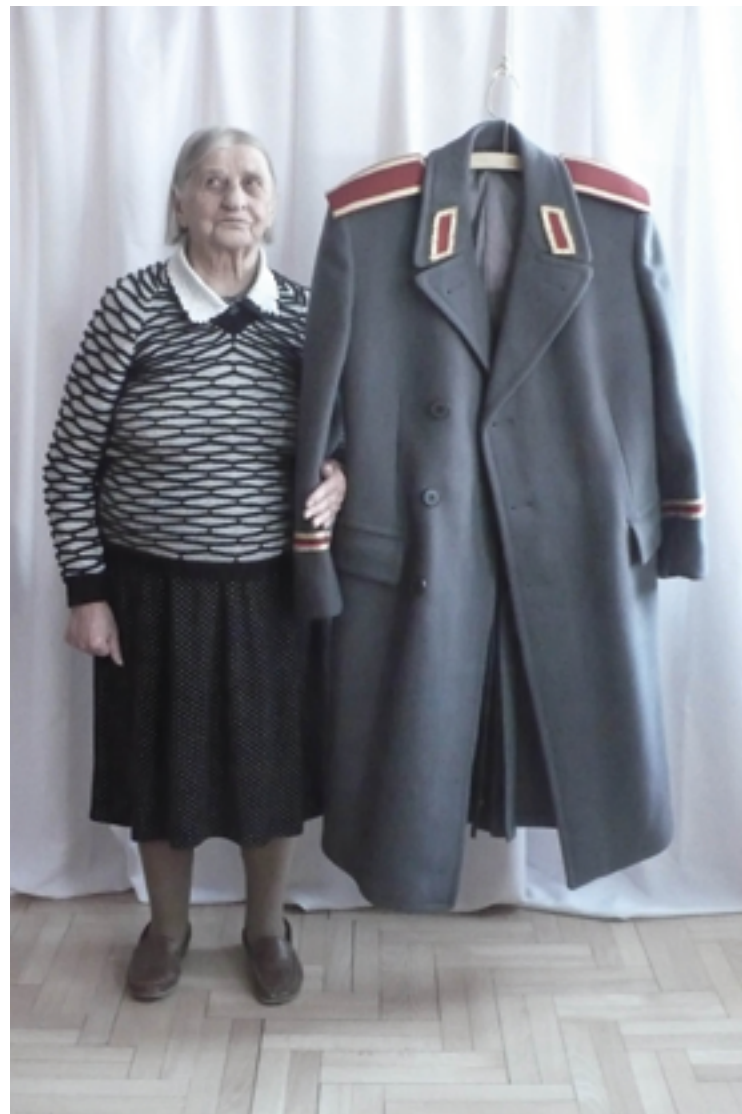
ON 2 2013