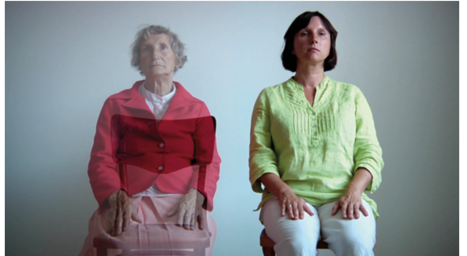
STOPKLATKA MATKA 2015