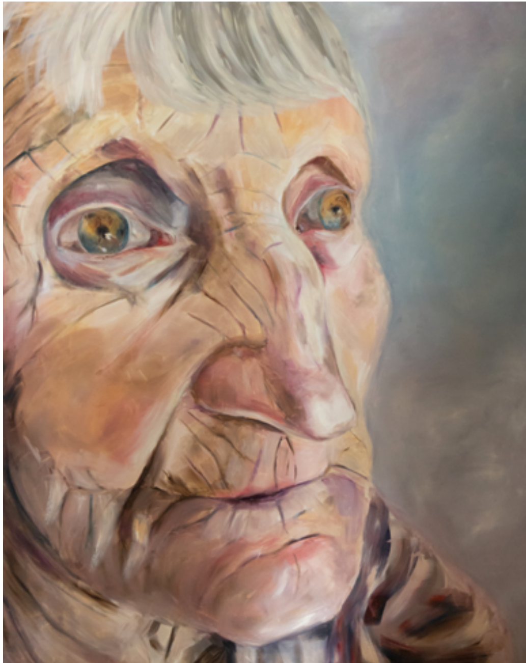
TWARZ 1, 2 2021