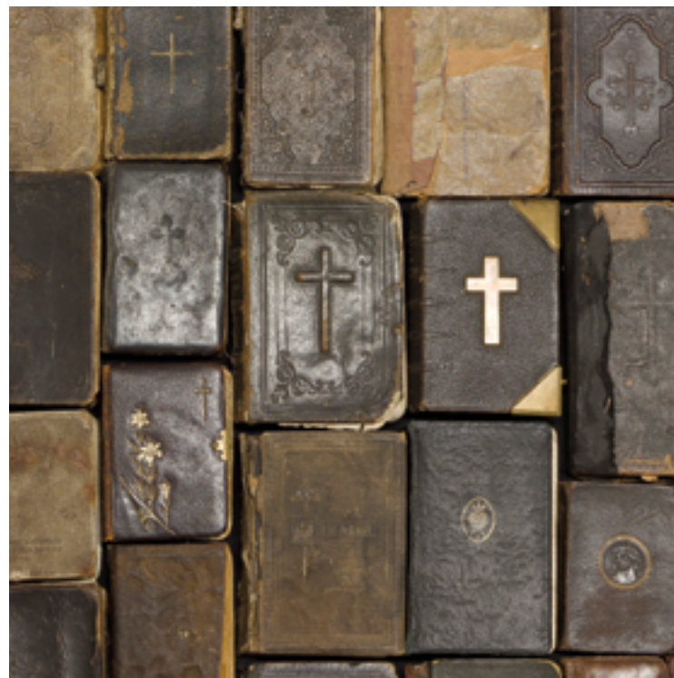
MODLITEWNIK B. R.

Wystawa w BWA w Kielcach jest częścią projektu w procesie, zapoczątkowanego w 2010 r w Galerii nad Wisłą w Toruniu.