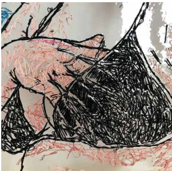
< SELFCARE CIAŁODORACJA Ręka – fragment haft, folia, nić 2022