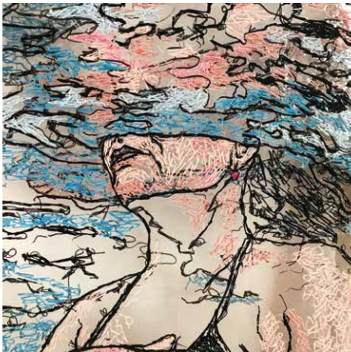
< SELFCARE CIAŁODORACJA Twarz – fragment haft, folia, nić 2022